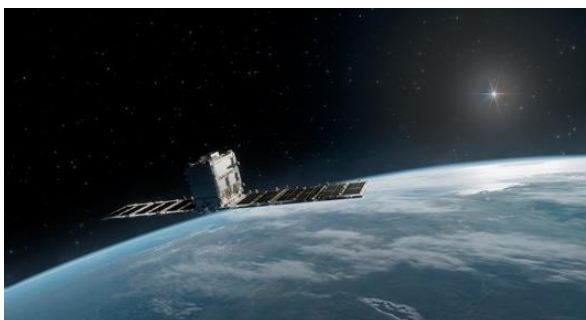
【Synspective の小型 SAR 衛星】