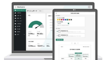
工事現場仕事向けSaaS型業務支援システム