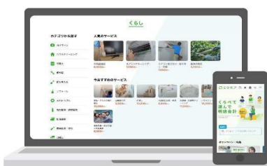
集客・見積もり比較プラットフォーム