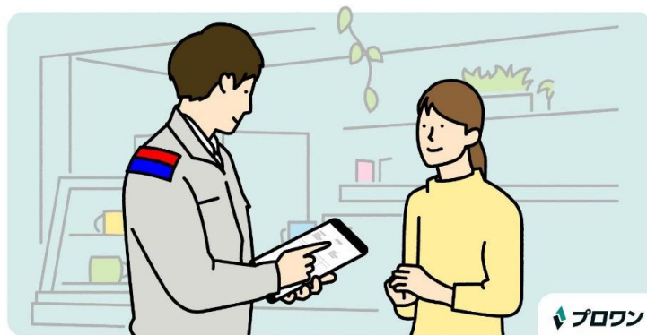
【プロワン】現場での業務を効率化