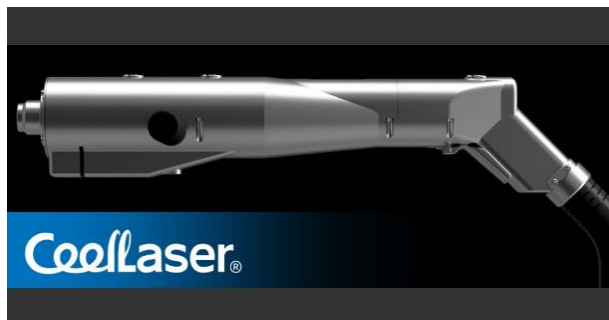
【高出カサビ取りレーザー：CoolLaser】